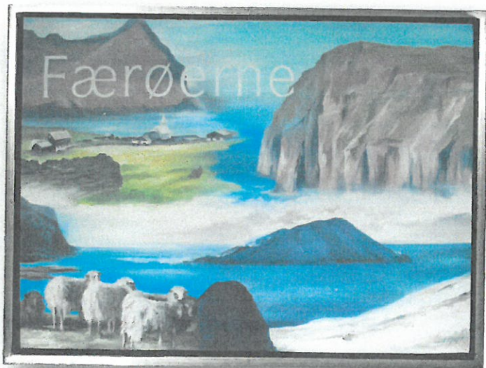
Færøerne - Olie på lærred 60x80 cm