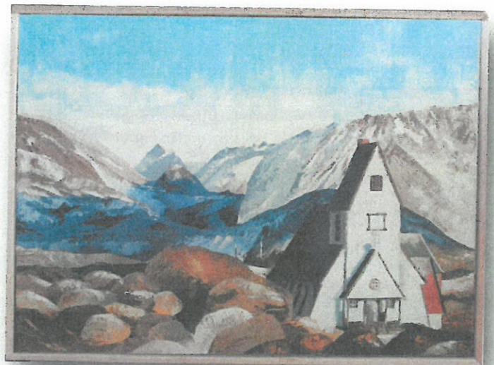
Nanortalik - Olie på lærred 60x80 cm