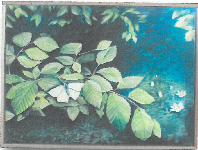
Skoven i maj - Olie på lærred 60x80 cm

Fernisering torsdag d. 3. marts kl. 12.15