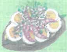
ÆG & REJER KR 99 EGG & SHRIMPS