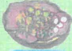
ROASTBEEF KR 99 ROAST BEEF