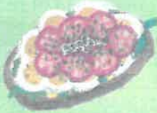
ÆG & TOMAT KR 79 EGG & TOMATO