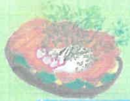
ROKET LAKS KR 99 SMOKED SALMON