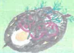
CHRISTIANO SOLBERG SILD KR 99 HEERING FROM CHRISTIANIA