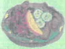
ANDECONFIT KR 99 DUCK CONFIT