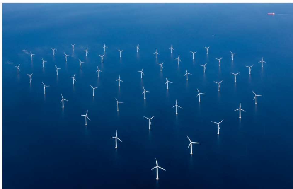
Windmills of the sea