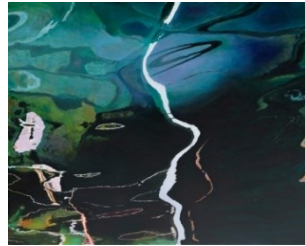
Water reflections in the harbor, 100 x 80 cm.

Kunstforedrag af SteenR i dagligstuen torsdag den 8. februar 2024 kl. 15.00 - 16.00. Der kan købes et glas vin til 10 kr.